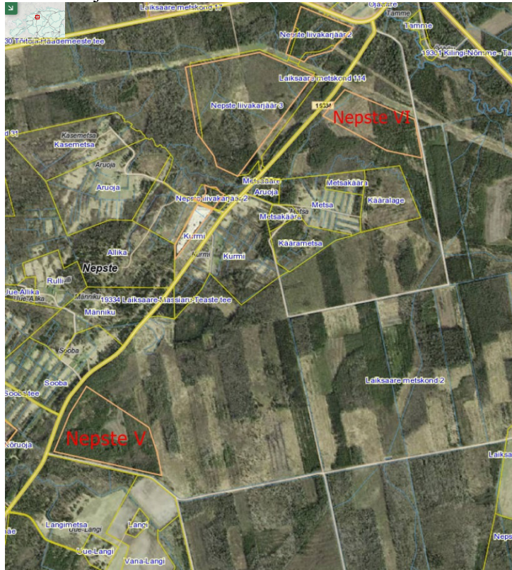
Joonis 1. Nepste V ja Nepste VI liivakarjääride asukohad.

Kavandatava tegevuse eesmärgiks on Pärnu maakonnas Hädemeeste vallas Nepste külas Laiksaare metskond 2 kinnistul (Joonis 1) ehitus- ja täiteliiva kaevandamine, mida on plaanis kasutada tsiviil- ja teedeehituses. Eelkõige kulub täitematerjali Rail Balticu ehitusele, kui ka lähipiirkonnas asuvate teede ehituseks- ja rekonstrueerimiseks.